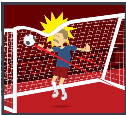
2 Het doel altijd verzwaren of verankeren.