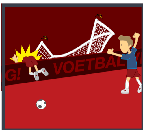
4 Niet in het doel klimmen!