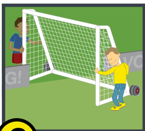
3 De doelen veilig verplaatsen!