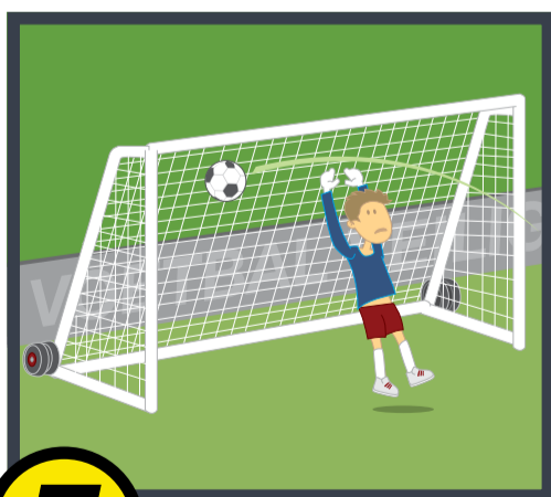
7 Gebruik de doelen op de juiste manier!