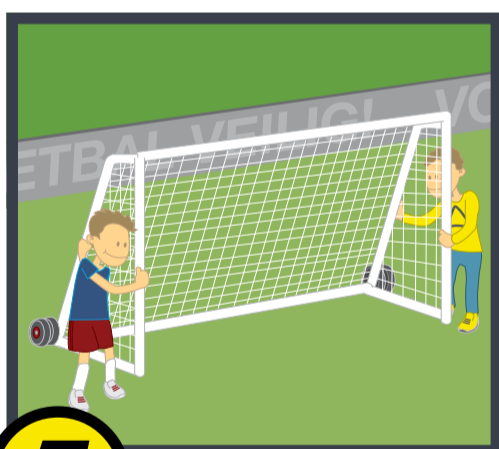
5 De doelen altijd met ten minste 2 personen verplaatsen.