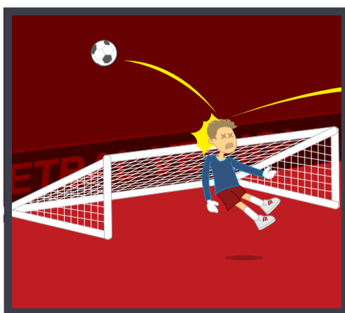
8 Beveilig de doelen tegen onbevoegd gebruik!